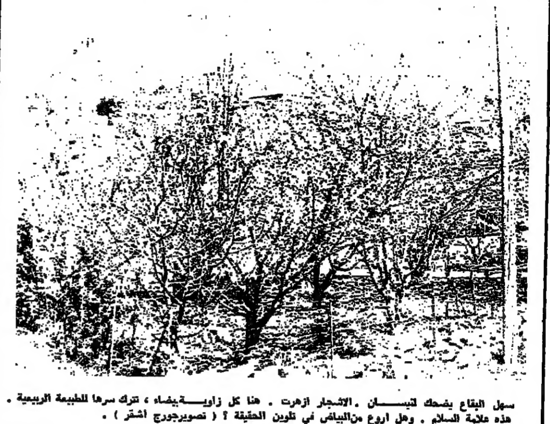
سهل البقاع يضحك لتيسان . اشجار ازهرت . هنا كل زاوية يشاه ، تترك سرها للطبيعة الربيعية . هذه ملاحظة السلام . وهل اروع من البياض في تكوين الحقيقة ؟ ( تصوير جورج اشقر ) .